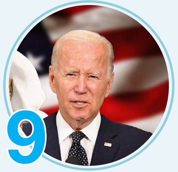
مكاسب أمريكية متعددة