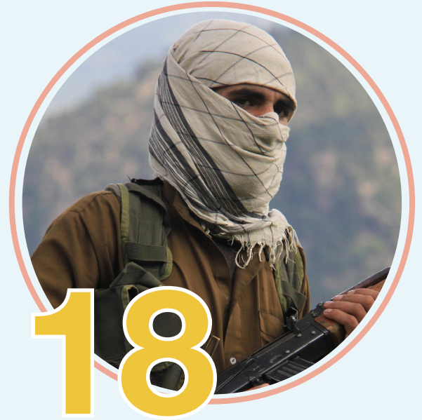
"داعش" وتصاعد التهديد