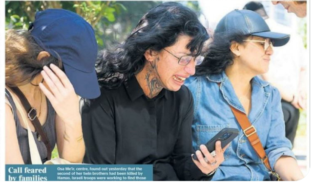
Call feared by families

Mother and daughter watched anxiously as other families were ferried into glass-walled rooms. Scents of sudden grief carried through the building as, one by one they heard news that "no longer ones had been killed."