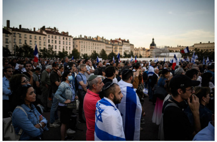
Lors du rassemblement à Lyon en soutien à Israël, mardi 10 octobre.

Un millier de personnes se sont rassemblées place Bellecour ce mardi 10 octobre soir à l'appel du Crif. Juives pour la plupart, horrifiées par le fanatisme et solidaires pour dénoncer le massacre de civils.