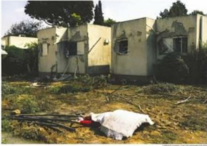
A woman lies dead in Kfar Aza, days after Hamas militants attacked the rural community in southern Israel. The attack of deaths was heavy Tuesday around the village of about 400 residents, and scores of Hamas soldiers were scattered every few hundred yards.

Biden's national security adviser, John Heilson, said that the administration would not disclose the names of any