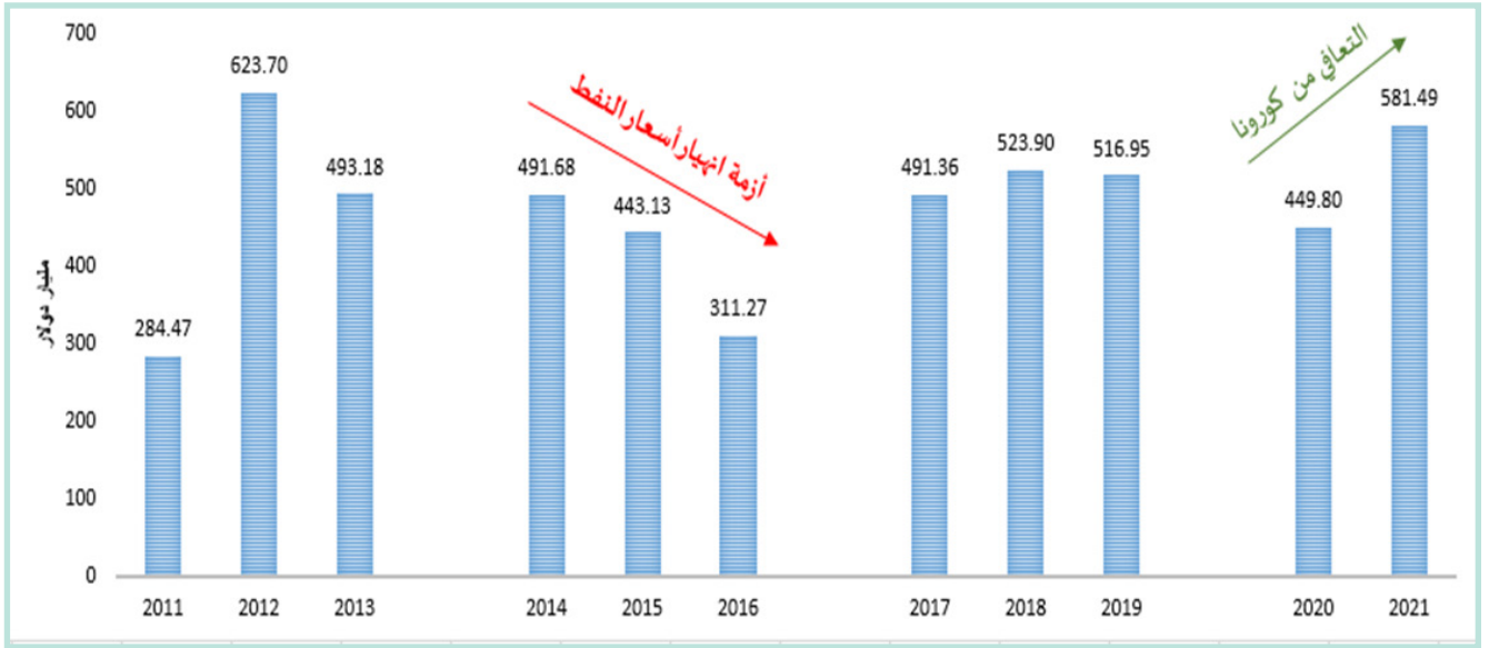
الشكل 1- حجم التبادل التجاري بين الخليج وآسيا (مليار دولار)