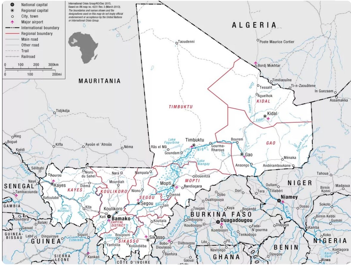
خريطة رقم (1): خريطة إدارية لدولة مالي